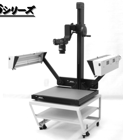
型式：FE (バックライトなし) 光源：蛍光灯 ステージサイズ：520×420 mm