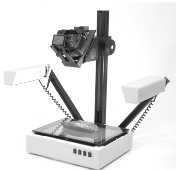
型式：4A 光源：蛍光灯 ステージサイズ：365×283 mm