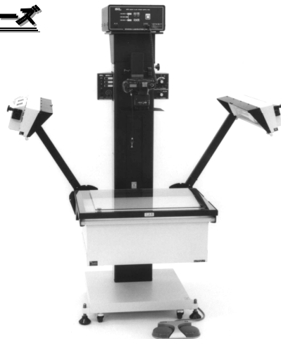
型式：XD (ステージ電動昇降式) 光源：キセノンランプ&蛍光灯 ステージサイズ：612×460 mm