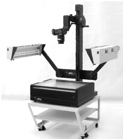
型式：FA(バックライト付き) 光源：蛍光灯 ステージサイズ：520×420 mm